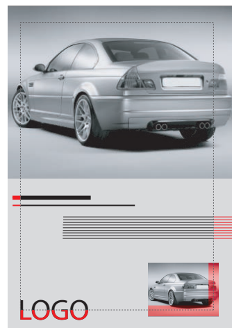
Pleine page de gauche - non-conforme Volle pagina links - niet-passend

Haut - boven = 16 mm Bas - beneden = 22,5 mm Intérieur - binnen = 16 mm Extérieur - buiten = 23 mm