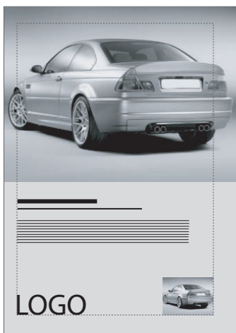
Pleine page de gauche - conforme Volle pagina links - passend

Opgelet! Volle pagina's moeten binnen de opgelegde marges passen. Uitsluitend de achtergrond en aflopende beelden mogen deze marges overschrijden. Teksten en beelden moeten uitdrukkelijk binnen deze marges blijven. De voorbeelden hieronder gelden als referentie.